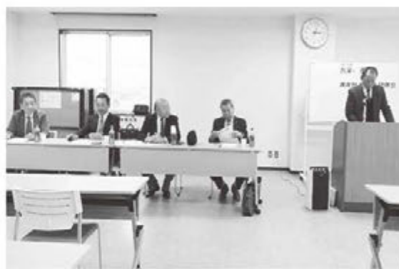
右から笹崎署長、塩崎支部長、武藤顧問、横山副支部長、笹川副支部長