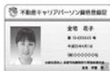
顔写真付登録証カード