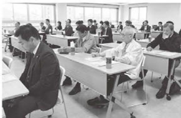
税金に対する関心の高さがうかがえた研修会