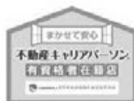
資格登録者在籍店ステッカー