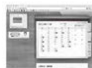
資格登録者専用サイト